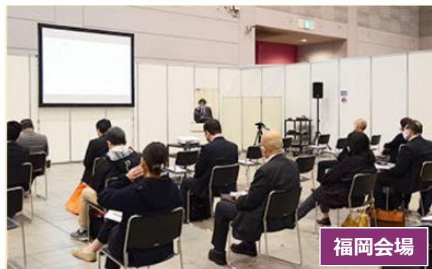
「密」を避けるため、 座席間隔を空けたセミナーレイアウト