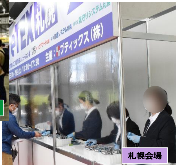
受付の飛沫防止ビニール