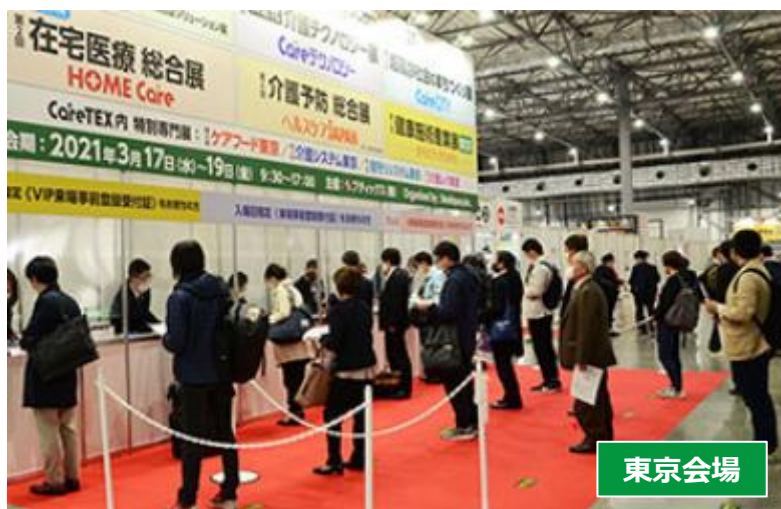
床面に待機位置をマーカー表示