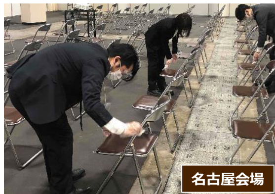
セミナーの間に随時、座席を消毒