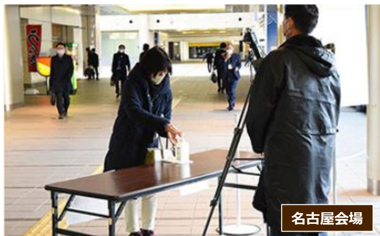
運営スタッフが手指消毒を声がけ