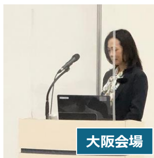
セミナー講演台の亚克力板