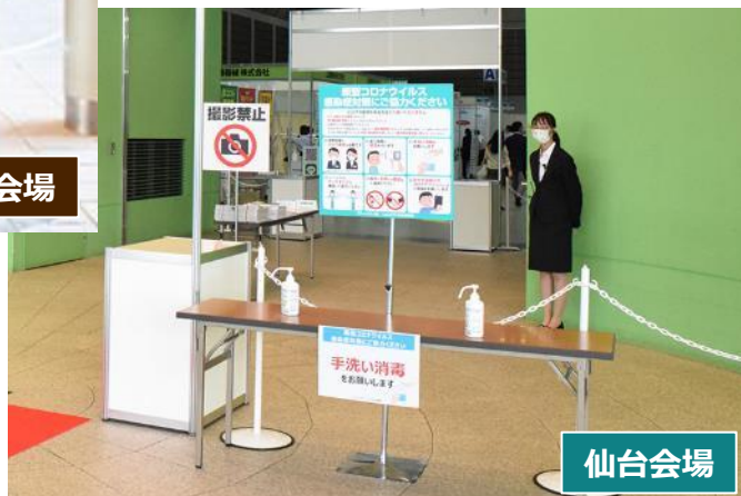
マスク着用必須などの注意喚起看板