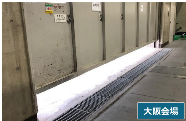
会場内空調に加え、搬入用シャッターを適時開放し換気