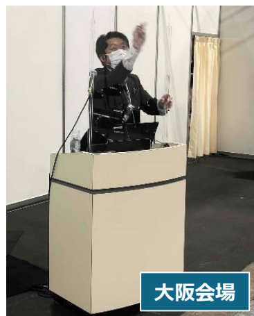
セミナーの間に随時、 亚克力板・マイクを消毒